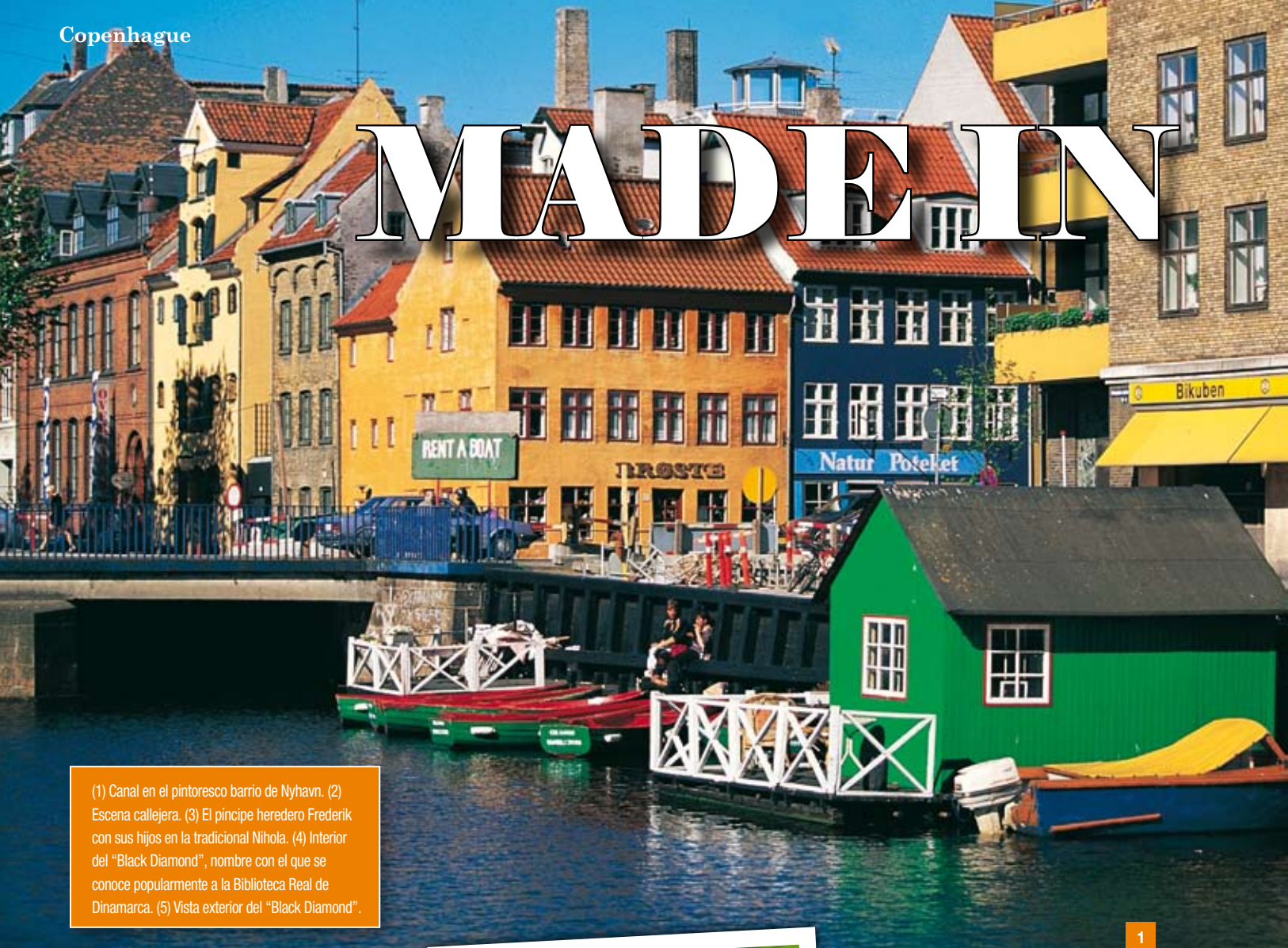
(1) Canal en el pintoresco barrio de Nyhavn. (2) Escena callejera. (3) El príncipe heredero Frederik con sus hijos en la tradicional Nihola. (4) Interior del "Black Diamond", nombre con el que se conoce popularmente a la Biblioteca Real de Dinamarca. (5) Vista exterior del "Black Diamond".